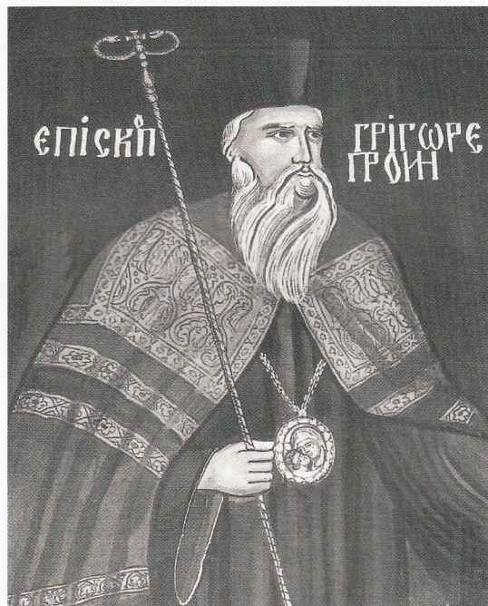
Grigorie Socoteanu, episcop al Râmnicului (portret de la biserica „Toți Sfinții“, Râmnicu Vâlcea)