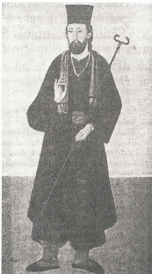
Filaret, episcopul Râmnicului, în straie de preot-țaran [pictură murală de la biserica Grecii (vechi) Romanaiți]

mers mai departe de chipul monahicesc cel mic (monah). În anii 1770–1771 a fost ieromonah, egumen, al mănăstirii Arnota, perioadă în care Grigorie Socoteanu este instalat de domnitorul Giani-Ruset în fruntea Bisericii Țării Românești, ca mitropolit (GC, p. 190). Se crede, de asemenea, că, la înlăturarea din scaun în 1771 a mitropolitului Socoteanu de către ruși, Dionisie se mută sau a fost chemat din nou la Episcopia Râmnicului de către arhimandritul proaspăt numit Chesarie, care va fi ales la sfârșitul anului 1773 în scaunul de episcop. Din acest an încolo are loc numirea sa, cel mai probabil în 1786, ca ecleziarh al Episcopiei Râmnicului, organizator și păstrător al Arhivei, de unde își asumă numele cu care a rămas în istorie – Dionisie Eclesiarhul . În timpul păstoriei sale, episcopul Chesarie